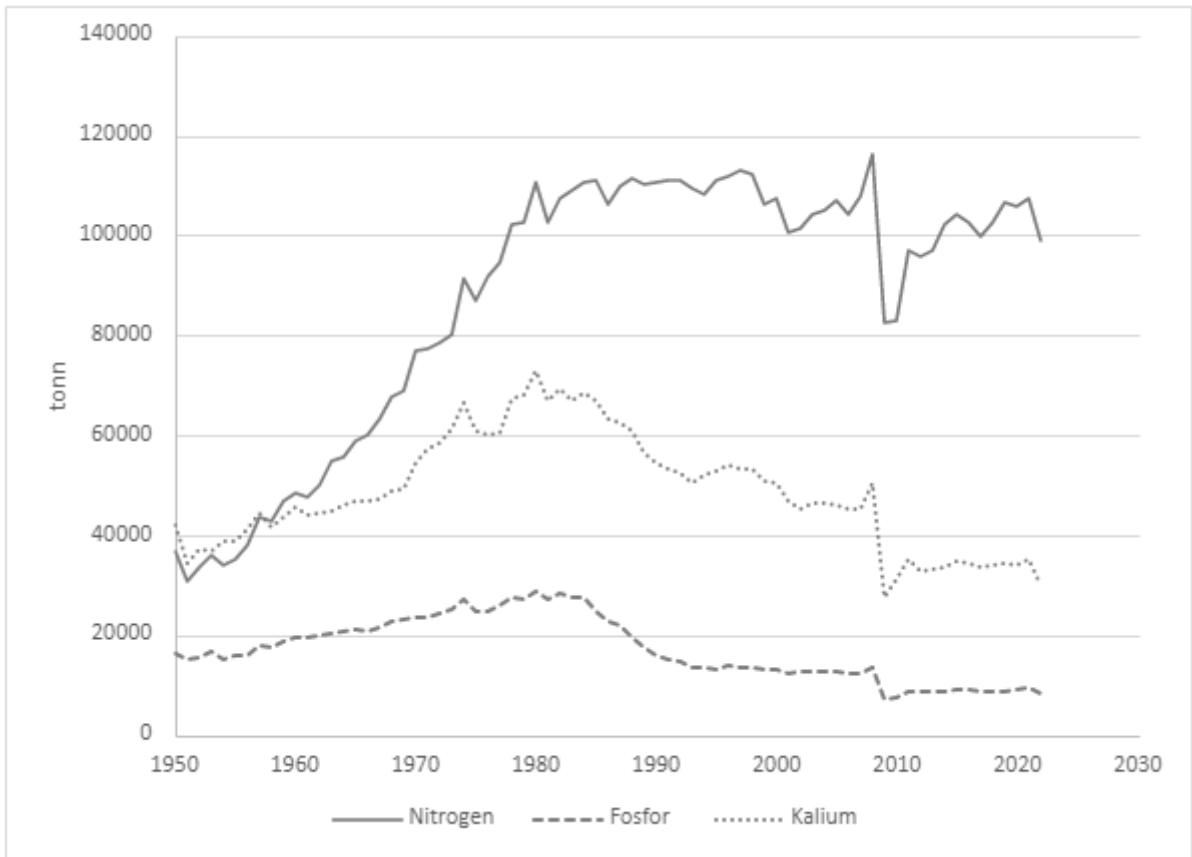
Figur 1. Omsetning av nitrogen, fosfor og kalium i mineralgjødning fra vekstsesongen 1949/1950 til og med vekstsesongen 2021/2022. Omsetning er oppgitt i tonn.