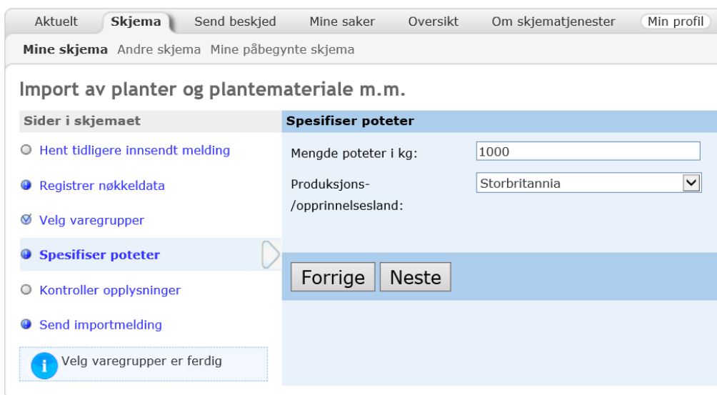
Figur 5 – Innmelding av potet: Etter å ha valgt poteter som varegruppe kommer du til menyen "spesifiser poteter". Her legger du inn mengde poteter som skal importeres og hva som er produksjonslandet.