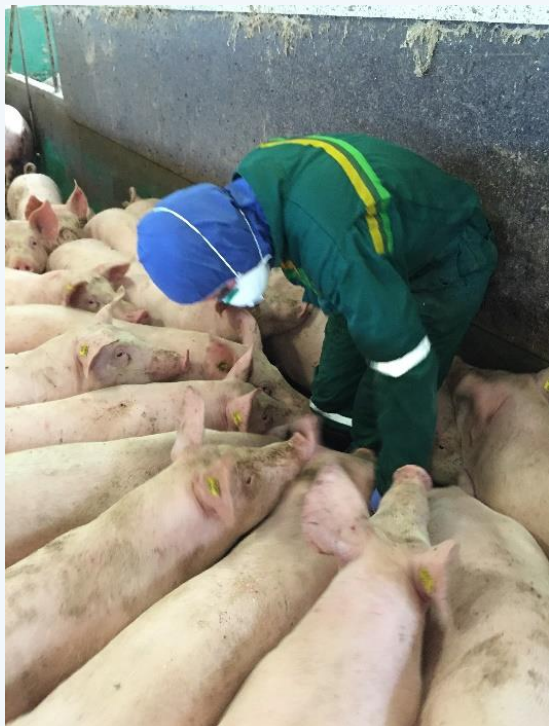
Inspektør fra Mattilsynet på tilsyn i svinebesetning.

Mattilsynet består av et hovedkontor og fem regioner, og vi har avdelingskontorer over hele landet.