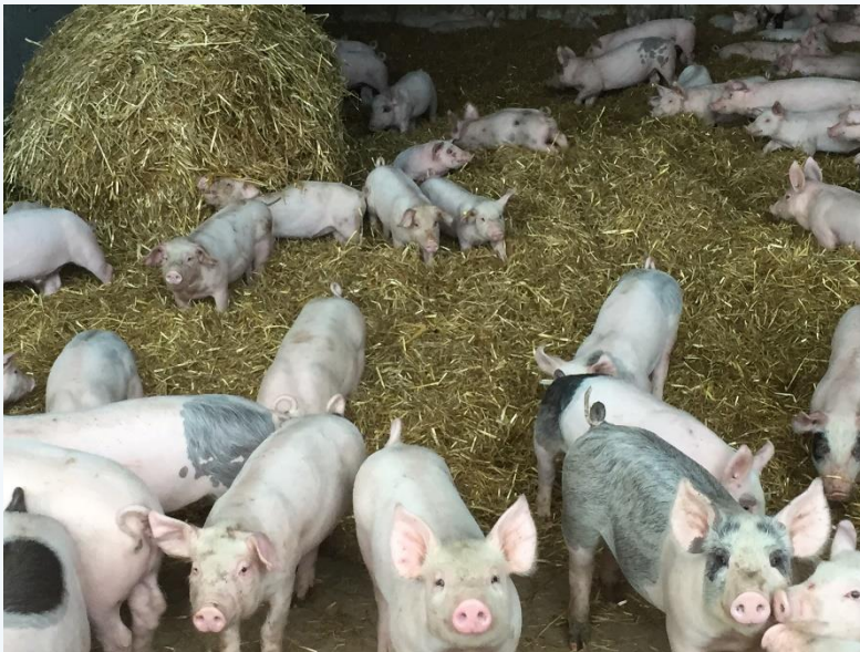
Smågris i grisehus.

I 2020 har vi planlagt en landsomfattende tilsynskampanje om velferd hos svin.