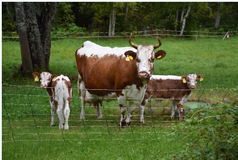
Telemarksku med tvillingkalver er et uvanlig syn.

Antallet dyrehold med produksjonsdyr har sunket over flere år. Samtidig øker det totale antallet dyrehold som er registrert hos Mattilsynet. Økningen skyldes nye registreringer av kjæledyr og «andre». Alle dyrehold med produksjonsdyr og alle hestehold med mer enn 10 hester skal være