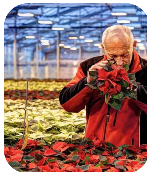
Visuell inspeksjon med håndlupe.

Her ser du bilder av noen av de aktuelle karanteneskadegjørerne. Du som gjennomfører mottakskontrollen, må ha kunnskap om hvilke karanteneskadegjørere som er relevante for plantekulturene dere importerer, og hvordan du kjenner igjen symptomer på disse.