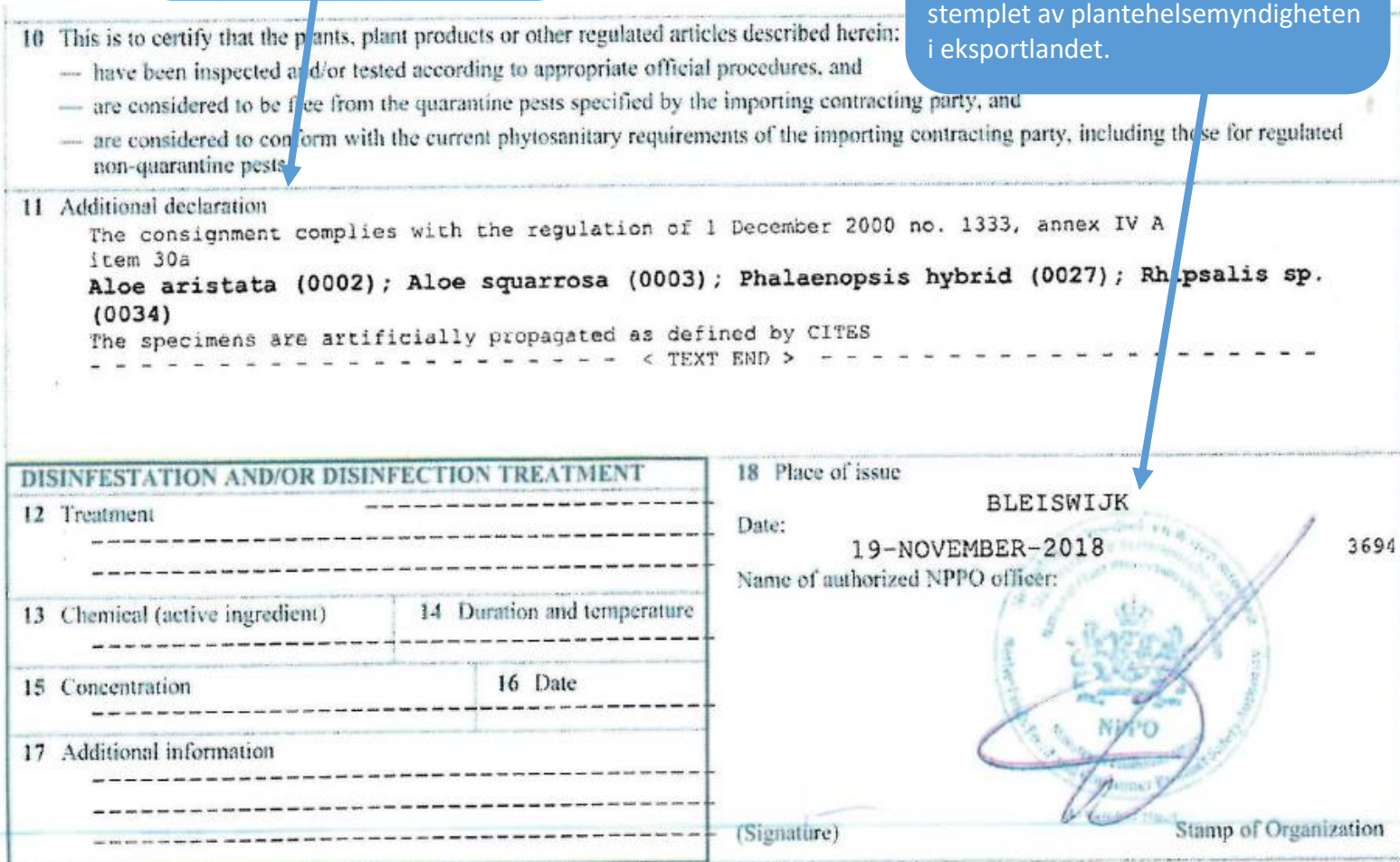
Figur 4 - Eksempel på hvordan et plantesunnhetssertifikat ser ut. Dette er nederste halvdel av sertifikatet.

Sertifikatet skal være signert og stemplet av plantehelsemyndigheten i eksportlandet.