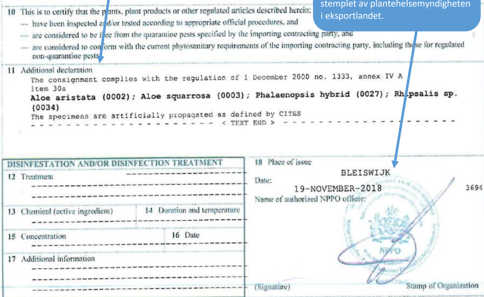
Figur 4 - Eksempel på hvordan et plantesunnhetssertifikat ser ut. Dette er nederste halvdel av sertifikatet.

Sertifikatet skal være signert og stemplet av plantehelsemyndigheten i eksportlandet.