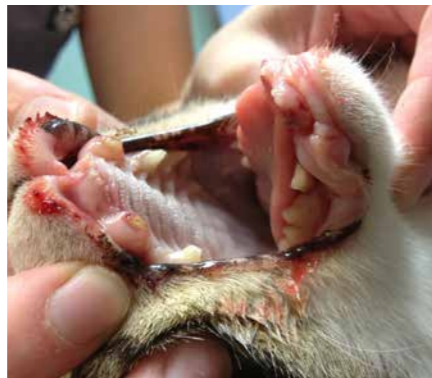
Hjemløs katt med brukne tenner.

Det er mange hjemløse katter som lider fordi de sult, fryser eller er syke etter å ha kommet bort fra eieren sin eller blitt født uten et hjem. Noen mennesker ønsker å være snille med disse kattene og legger ut mat til dem. Det kan tiltrekke seg flere katter, og matmoren eller matfaren mister til slutt kontrollen over alle kattene. Vi har flere eksempler på katterkolonier som har bestått av mellom 20 og 130 katter. Mattilsynet må flere ganger i året gripe inn og avlive katter som lider i slike kolonier fordi de er underernærte og syke. De er ofte sky og redd mennesker, og det kan være vanskelig å omplassere dem fordi de har vært hjemløse over lang tid.